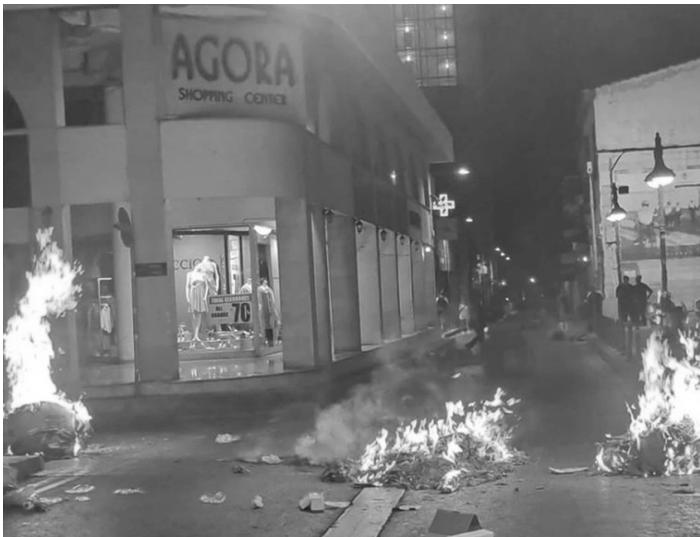
Καμένοι κάδοι στην οδό Ανεξαρτησίας

Μετά το πογκρόμ στη Χλώρακα και ειδικότερα μετά το πογκρόμ στη Λεμεσό, όλα τα κόμματα κινήθηκαν με τις αναμενόμενες δηλώσεις του τύπου: «Καταδικάζουμε την βία από όπου και αν προέρχεται», ρίχνοντας τις ευθύνες στους «κουκουλοφόρους», την κυβέρνηση και την αστυνομία, από διαφορετική πολιτική θέση βέβαια η κάθε πλευρά. Μετά από την διεθνή έκθεση των όσων συνέβησαν στην Λεμεσό, με διεθνείς τίτλους ειδήσεων να μιλούν για την «κυπριακή νύχτα των κρυστάλλων» και για «πογκρόμ», τα κόμματα και τα ντόπια ΜΜΕ «σκήρυξαν» την στάση τους απέναντι στους φασίστες. Άρχισαν σιγά σιγά να μετονομάζουν τους φασίστες από «χούλιγκανς» και «ακραία στοιχεία» σε «ρατσιστικά και ακροδεξιά στοιχεία», όπως επίσης άρχισαν να αλλάζουν τις ουδέτερες αναφορές για «επεισόδια», σε δημόσια καταγγελία για «ρατσιστική βία από ελληνοκυπρίους».